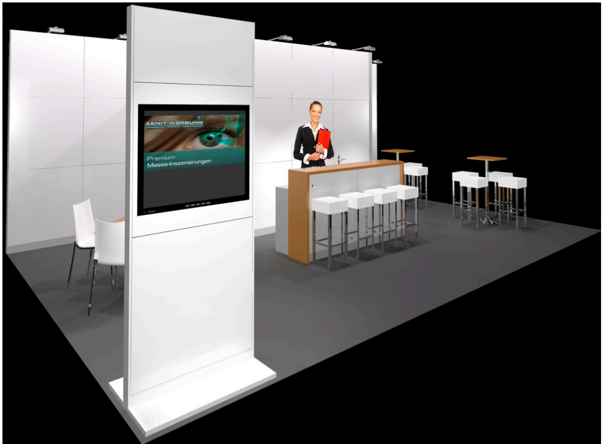
Die Einzelemente bestehen aus einem massiven, rechteckigen Rahmen, hergestellt aus formstabilem Multiplex. Das Rastermaß beträgt 1000 mm x 1000 mm.