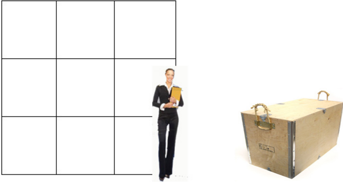
Eigene Transportkisten für Lagerung und Wiederaufbau